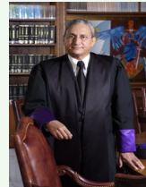
Jorge Subero Isa

Al fin y al cabo, la primera de estas Cámaras, la cual administra el proceso electoral, la preside un efusivo ex militante del Partido de la Liberación Dominicana.